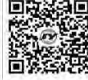
集团公司 公众微信账号